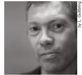
by L. Gullberg

Tavolo rettangolare in due dimensioni, in rovere naturale o cenere o santos naturale. La versione in rovere naturale è disponibile anche con piano in linoleum di colore nero.