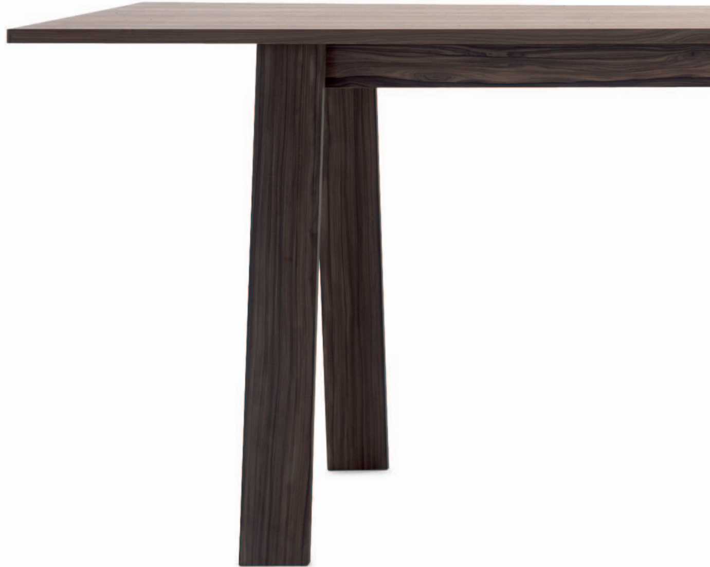
BAC Jasper Morrison 2005