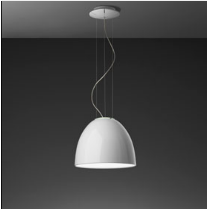
A244900 Nur Mini Gloss Halo Weiß

Die neue Hochglanzpolitur verleiht dem Klassiker Nur eine besondere Eleganz. Erhältlich für Halogen-, Leuchtstoff- oder Metalldampfampe.