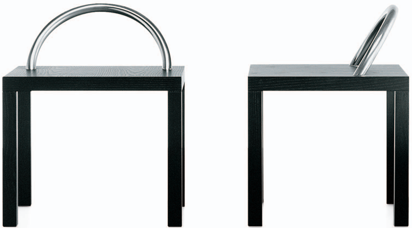
KO-KO Shiro Kuramata 1986