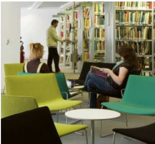
1 Inaugure Barcelona, Spain Art. 2009