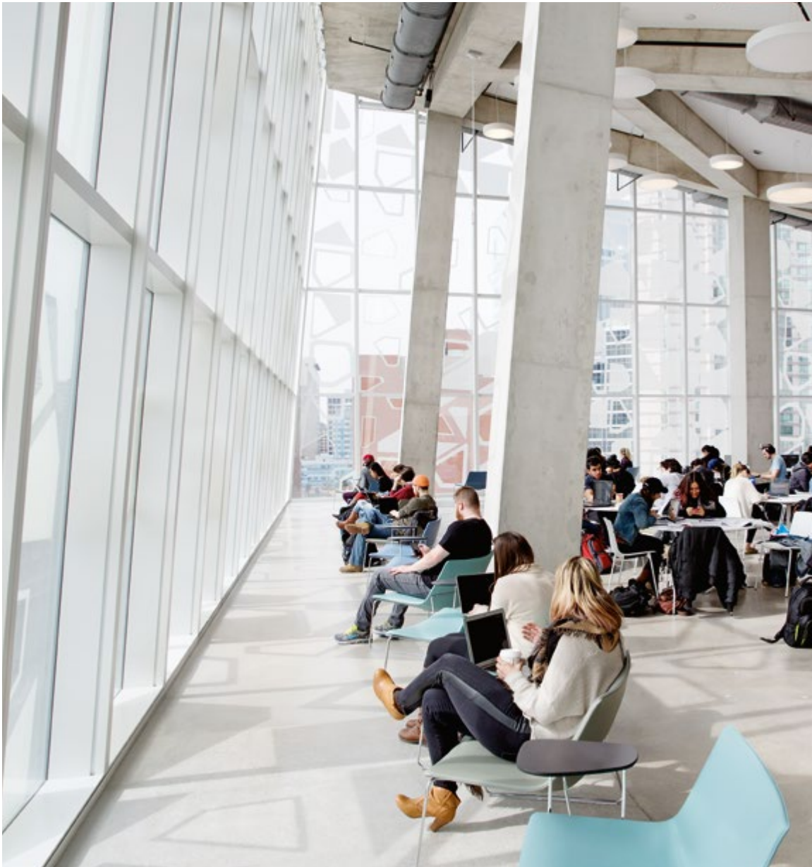
1 Ryerson University Student Learning Centre Toronto, Canada Art. 2033