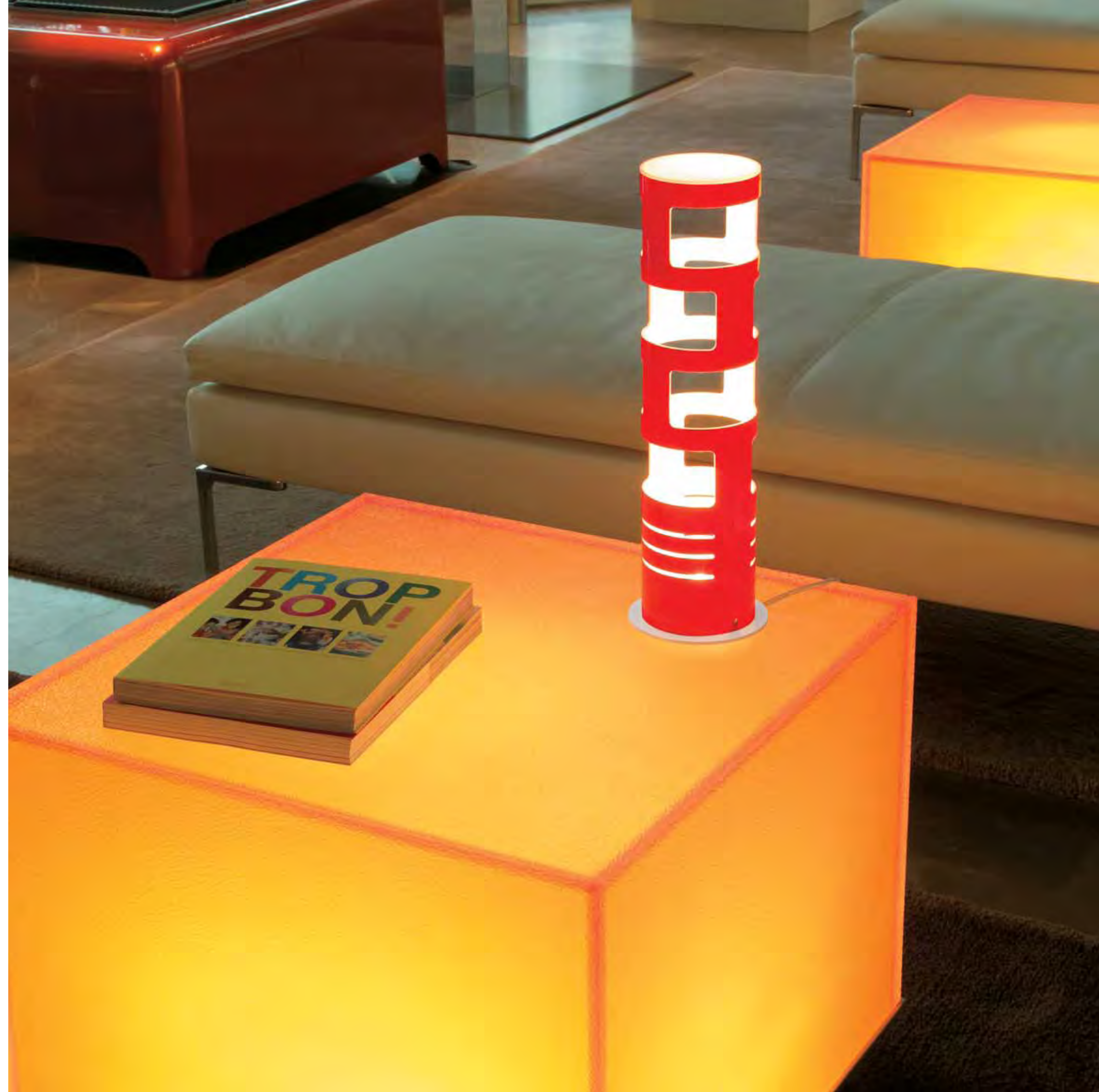
SAMA table / GREGORIO SPINI / 2004