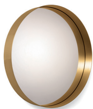
Messing, Kristallglas Brass, crystal glass NEW VERSION 2018

Marco de latón macizo, natural o pavonado, lacado transparente. Espejo de cristal o de vidrio tintado de color bronce. Para más detalles y colores, ver lista de precios.