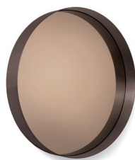
Messing brüniert, Parsolglas Burnished brass, smoked glass NEW VERSION 2018