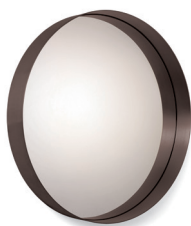
Messing brüniert, Kristallglas Burnished brass, crystal glass NEW VERSION 2018