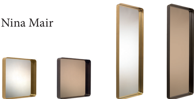
Cypris Mirror 2015