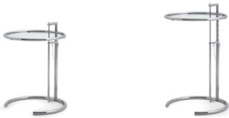
Kristallglas klar crystal glass clear

Mesa auxiliar de altura regulable. Estructura de tubos de acero cromado. Placa de cristal claro, gris parsol o de metal barnizado en negro. Detalles ver lista de precios.