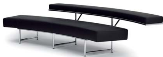
MONTE CARLO 1929