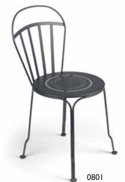
0801 Stacking chair Stuhl, stapelbar

Registered trademark Exklusives patentiertes Modell