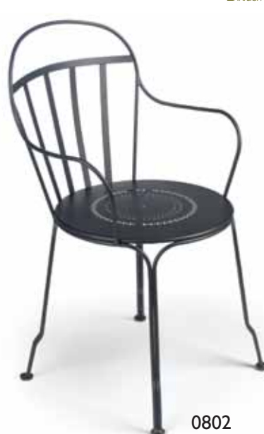
0802 Stacking armchair Sessel, stapelbar