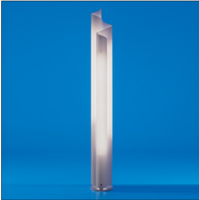
0081 010A Chimera Weiß

Sockel aus weiß lackiertem Metall; Rahmen/Leuchtschirm aus opalweißem Metakrylat, heiß gebogen. Diffuse und gefilterte Lichtverteilung.